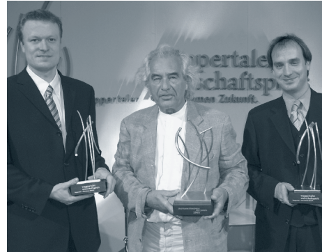
Die Preisträger 2003