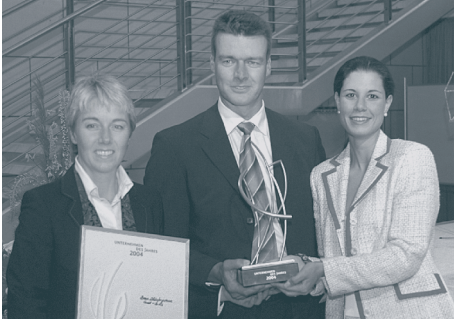
Fa. Brose, Steiger 2004 Skulptur „Schwung“; B. Schroedi

Wenn möglichst viele dieser Kriterien auf Ihr oder ein Ihnen bekanntes Unternehmen zutreffen, freuen wir uns auf Ihre Mitteilung.