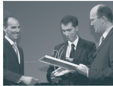
Fa. Ceteq, Sieger 2004

Der Preis „Start-Up des Jahres“ wird an Existenzgründer in Wuppertal vergeben.