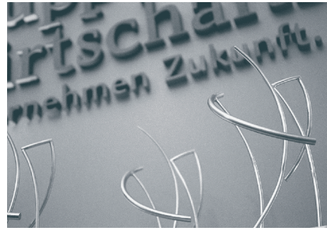
Skulptur: B. Schroedel

Der Wuppertaler Wirtschaftspreis wird in den Kategorien „Stadtmarketingpreis des Jahres“, „Unternehmen des Jahres“ und „Start-Up des Jahres“ verliehen.