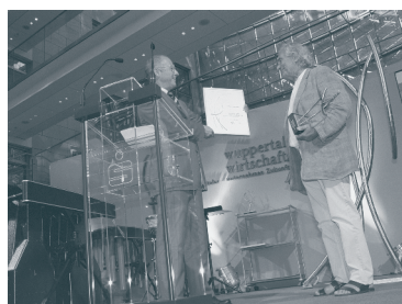
Stadtmarketing 2003: Fa. Dinnebier