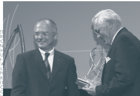
Jackstadt-Stiftung, Sieger 2004

Wuppertal als spannender Lebens- und Wirtschaftsraum wahrgenommen, der Investoren und Arbeitnehmer anzieht.