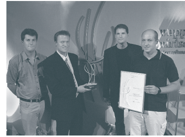
Start-Up d. J. 2003: Fa. Steurartech

„In der Region finden wir Kunden aus allen Branchen, die unsere Leistungen im Testen von Software und im Qualitätsmanagement benötigen.“ Tariq Odeh, CETEQ GmbH & Co. KG (Start-Up des Jahres 2004)