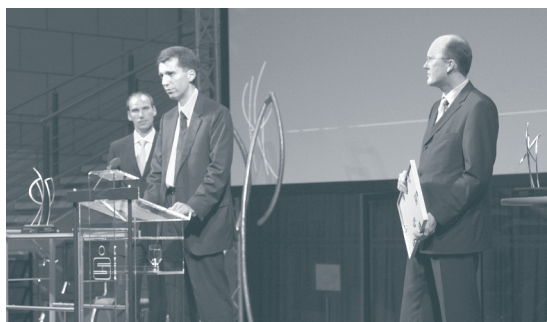
Fa. Ceteq, Sieger 2004