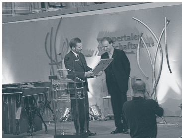
Unternehmen d. J. 2003: Fa. Riedel